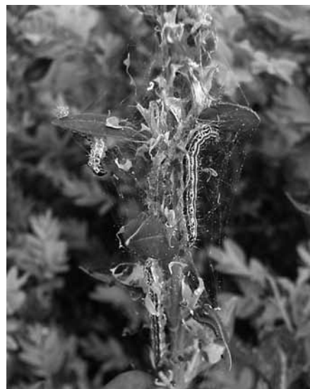
Foto: In Gesellschaft schmeckt's noch besser: Raupen des Buchsbaumzünslers in einem Gespinnst an ihrer Futterpflanze

In diesem Frühjahr wurden aus verschiedenen Gemeinden Schäden an Buchs durch Raupen gemeldet. Es handelt sich dabei um die Raupen des aus Asien stammenden Buchsbaumzünslers Glyphodes perspectalis . Dieser wurde zum ersten Mal im Jahr 2007 in Europa nachgewiesen und zwar bei Kehl und in Weil am Rhein. Seitdem hat sich der Falter rasant ausgebreitet: 2009 hatte er von Süden her Müllheim erreicht, dieses Jahr trat das Tier bereits in Freiburg, Pfaffenweiler und Vörsstetten auf. Der Falter stellt eine akute Bedrohung für alle Arten von Buchs dar. Er hat bei uns nur wenige natürliche Feinde und es kommt mehrmals im Jahr zur Eiablage. Dadurch ist eine starke Vermehrung möglich und befallene Buchspflanzen können durch die intensive Fraßtätigkeit der Raupen in ein oder zwei Jahren absterben.