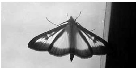
Bild: Die weiß-durchscheinenden Flügel mit dem schwarzen Rand machen den Buchsbaumzünsler unverwechselbar. Mit 3 bis 4 cm Spannweite ist der Falter recht ansehnlich

Um rechtzeitig gegen Neubefall vorzugehen, sind die Buchspflanzen regelmäßig zu kontrollieren . Das fordert große Aufmerksamkeit, denn die Raupen sind durch ihre gelbgrüne Farbe mit schwarzer Zeichnung gut getarnt. Fraßspuren, zusammengesponnene Blätter und Zweige und die darin hängenden gelb-grünen Kotkrümel sind ein Hinweis auf ihre Anwesenheit. Sobald die Raupen festgestellt werden, sollte ein zugelassenes Insektizid eingesetzt werden.