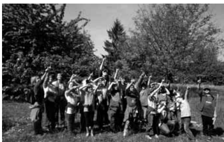
Kinder der Klasse 4, Sonnenbergschule